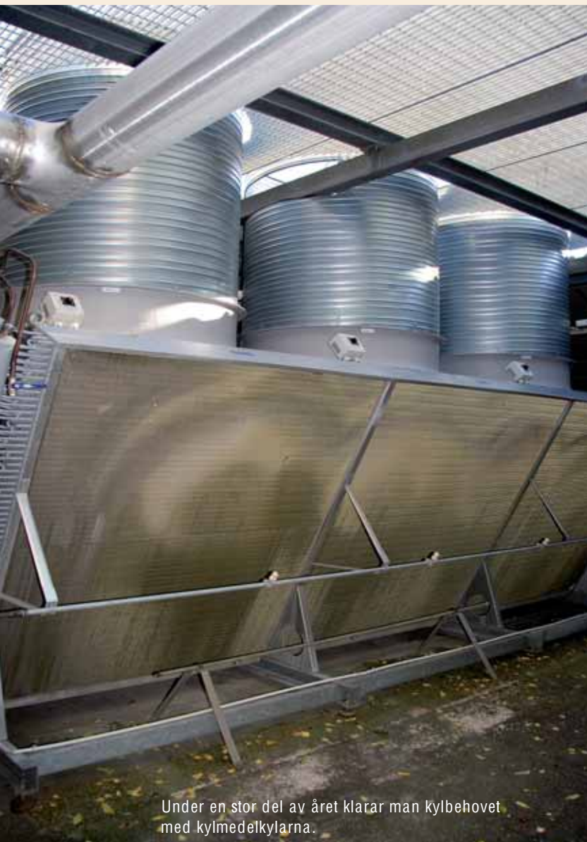
Under en stor del av året klarar man kylbehovet med kylmedelkylarna.

och kontinuerligt ut, och ju mer kyla som serverracksen längs vägen behöver desto mer ökar volymen på kudden. I den hall vi befinner oss i hade det gott och väl räckt med cirkulationsaggregaten längs den ena väggen, men man har placerat lika många på den motstående väggen för att höja säkerheten.