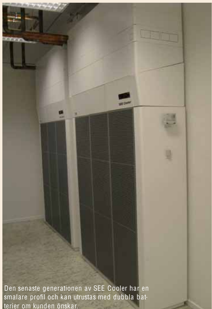
Den senaste generationen av SEE Cooler har en smalare profil och kan utrustas med dubbla batterier om kunden önskar.

– De här kör vi med ända tills att utomhustemperaturen når 15-16 grader, berättar Jerry när vi går ut och tar en titt på dem. Det räcker för att vi ska klara av att kyla vattnet för cirkulationsaggregaten till cirka 20 grader, vilket är tillräckligt för att hålla hallarna kalla.