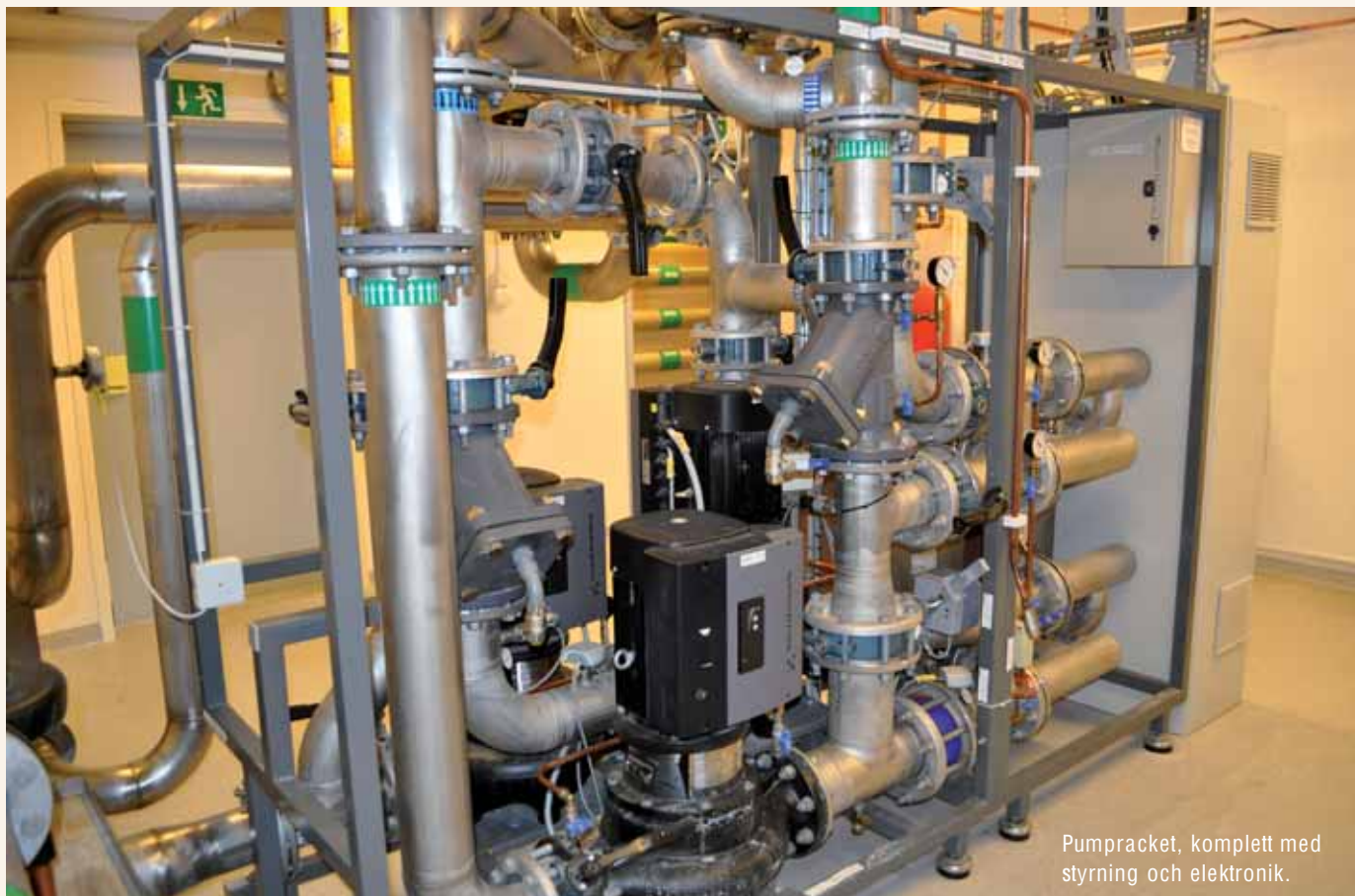
Pumpracket, komplett med styrning och elektronik.

Det man märker väl inne i den första teknikhallen, som rymmer ett antal serverrack placerade i långa rader, är att den inte är byggd med traditionellt datagolv. Istället för kylning underifrån kommer kylan från de aggregat som står längs med väggarna. Cirka tre meter höga och i princip helt tysta. I toppen på aggregaten, vinklade mot taket, sitter fläktarna som suger ner luften i aggregaten, cirkulationsaggregaten, och tvingar den över kylbatteriet innan luften trycks ut i hallen igen. Läger man handen mot gallret vid utblåset känns knappt något luftflöde alls.